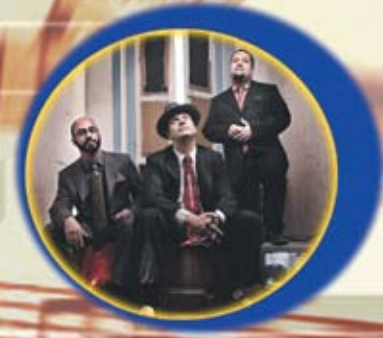
Quintas - Fenômenos Pedra Leticia